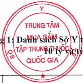
Bảng 1: Danh sách Sở Y tế tỉnh/thành phố và Bệnh viện trực thuộc Bộ Y tế có giá trị phân bổ trên 10 tỷ và tỷ lệ thực hiện kết quả trúng thầu danh mục đàm phán giá đến hết ngày 31/12/2022 dưới 50% theo tiến độ