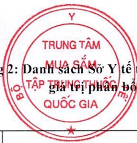
Bảng 2: Danh sách Sở Y tế tỉnh/thành phố có giá trị phân bổ trên 100 tỷ và Bệnh viện trực thuộc Bộ Y tế có giá trị phân bổ trên 20 tỷ có tỷ lệ thực hiện kết quả trúng thầu đấu thầu tập trung đến hết ngày 31/12/2022 dưới 50% theo tiến độ